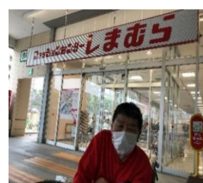
ついでに、しまむらへ