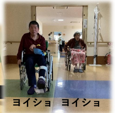
ヨイシヨ ヨイシヨ