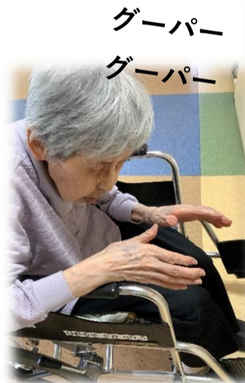
グーパー グーパー